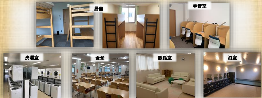
※写真は、立志寮と海風寮の様子です。

海風寮 ・中学生（一般生） ・アカデミック系列 スペシャリスト系列の高校生 ・トップアスリート系列の高校生 男子サッカー部