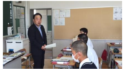
中津氏による広野町の歴史とこれから