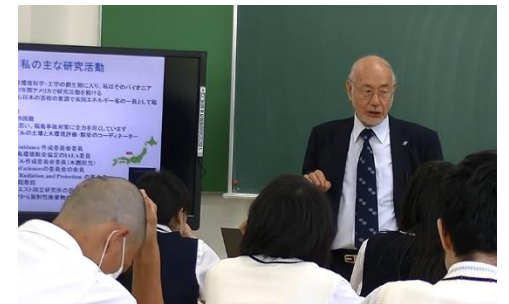
大西教授によるハンフォードサイトと原子力災害からの復興について