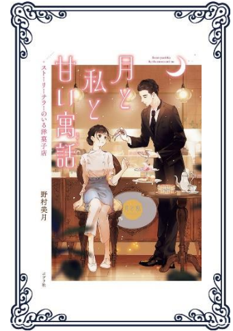
『月と私と甘い寓話』