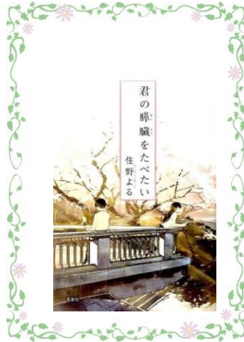
『君の臍臓を食べたい』