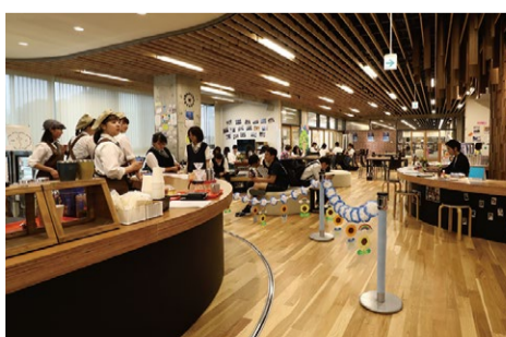
地域協働スペース 双葉みらいラボ、caféふう