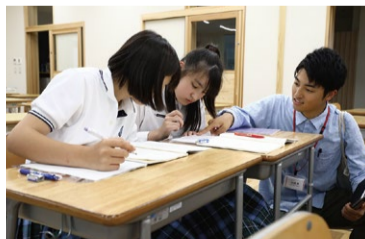
カタリバスタッフによるサポート