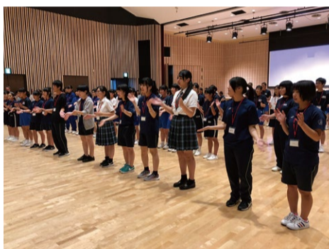
双葉郡中高生交流会