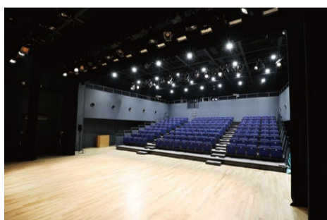
多目的ホール みらいシアター