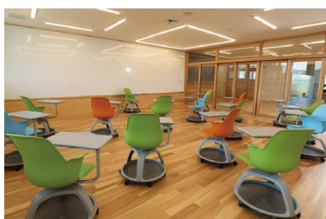
ALS(アクティブ・ラーニング・スペース)