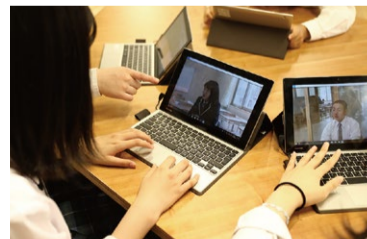
1人1台タブレットを積極活用

本校は文部科学省から、【スーパーグローバルハイスクール】(平成27～令和元)、【地域との協働による高等学校教育改革推進事業(グローバル型)】(令和2～4)に指定されています。