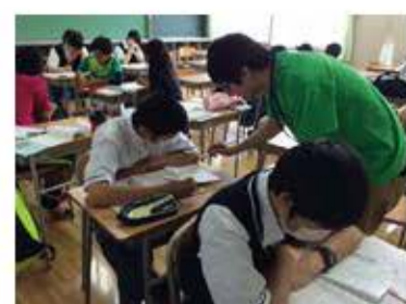
大学生による学習支援