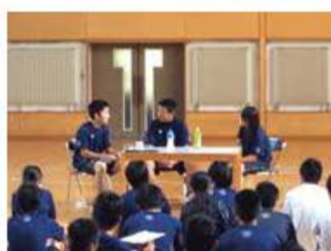
ふるさと創造学(演劇発表)