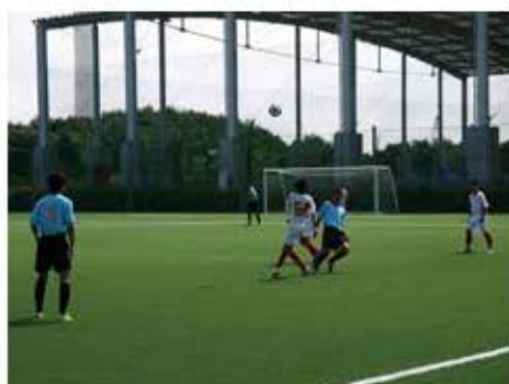
広野町サッカー場