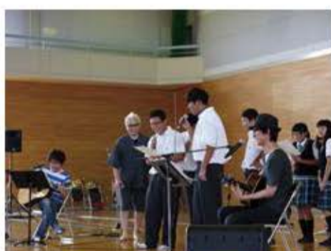
双葉郡中高交流会