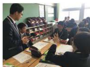
アクティブ・ラーニング授業風景