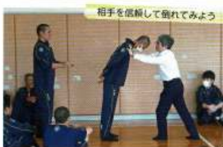
相手を信頼して倒れてみよう

生徒たちは広野町や橋本町に出向いて取材をし、その中から問題点を見つけ、全員で演劇による表現に挑戦します。今は初めての体験に戸惑っている様子ですが、取り組みの成長が楽しみです。